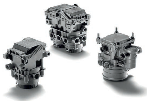
Тормозные клапаны MAN от 3 976,80 руб. с НДС