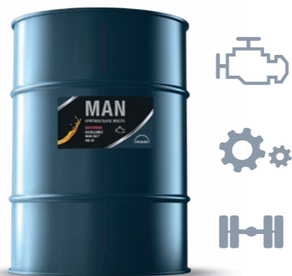
Оригинальное масло MAN