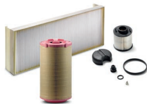
Оригинальные фильтры MAN